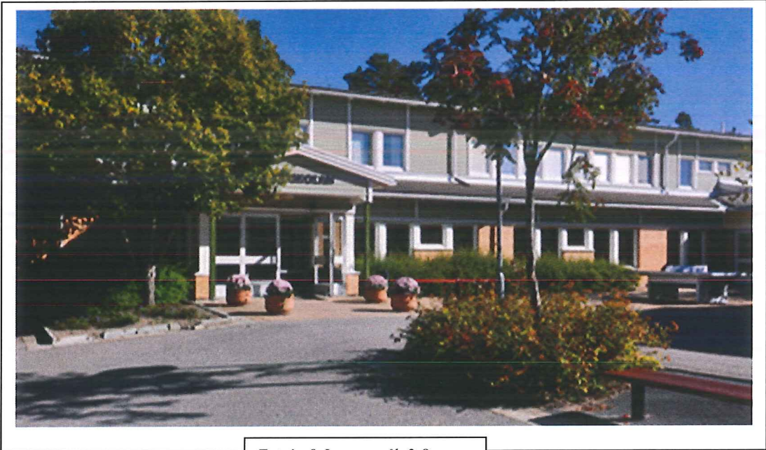
Entrén & Loungen åk 3-9